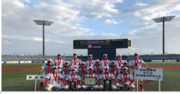
準優勝 新潟市消防局 2018.10.1 ハードオフエコスタジアム新潟