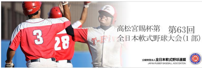
高松宮賜杯第 第63回 全日本軟式野球大会(1部)

公益財団法人全日本軟式野球連盟 JAPAN RUBBER BASEBALL ASSOCIATION